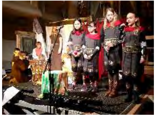
Krippenspiel der Kinder in Fraureuth