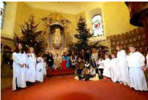
Krippenspiel der Kinder in Reinsdorf

Ein herzliches Dankeschön gilt auch in Reinsdorf allen beteiligten Mitarbeitern, allen Spendern der Kaffeetafel und allen Mitspielern und Betreuern bei den Krippenspielen.