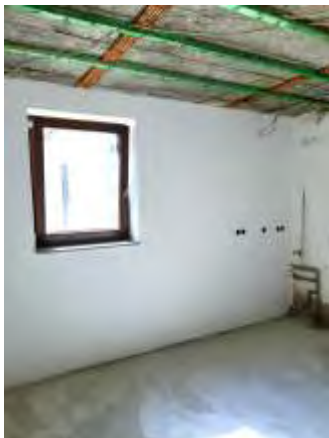
Renovierung der Küche in der Fraureuther Pfarrscheune

Nur durch Ihre Unterstützung mit der Zahlung von Kirchgeld wird die Realisierung vieler Projekte in unseren Gemeinden, wie z.B. die geplante Sanierung der Orgel in