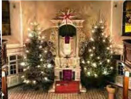
Weihnachten in Reinsdorf