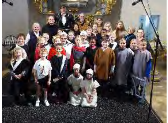
Musicalaufführung in der Fraureuther Kirche