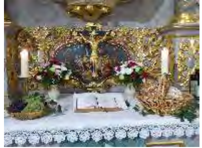
Erntedank 2022 in Fraureuth

Die Annahme der Erntedankgaben erfolgt am Sonnabend, den 30. September, in der Zeit von 14.00 Uhr bis 17.00 Uhr in der Kirche.