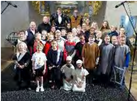
zum Kindermusical 2022